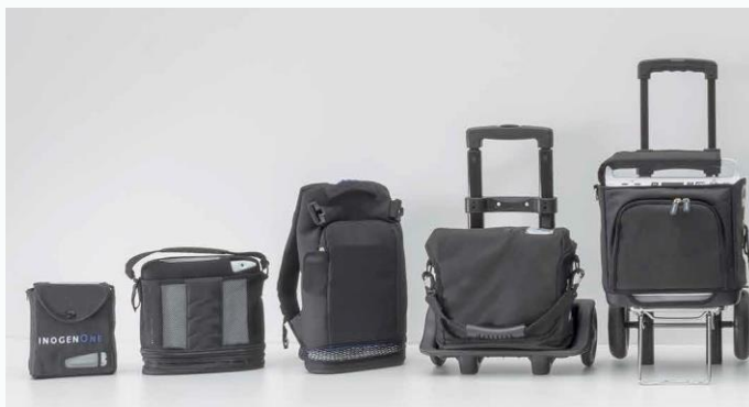
Draagbare zuurstofconcentrators.