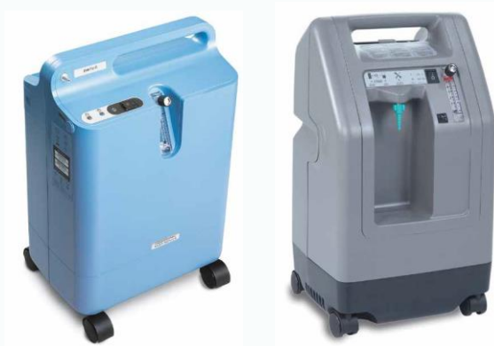
Vaste zuurstofconcentrators.

✓ Concentrator: mag vervoerd worden in de auto, bus, trein of boot. De vaste concentrator kan handig zijn wanneer u gedurende een bepaalde periode buitenshuis verblijft. Tijdens het transport kan gebruik gemaakt worden van een draagbaar gasflesje of een draagbare concentrator. Indien u met de auto reist, kan de draagbare concentrator gekoppeld worden aan de 12V-autolader zodat de batterijcapaciteit stabiel blijft.